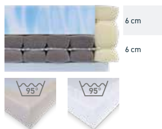
TreviraCS-Spannbezug Inko-Spannbezug, weiß