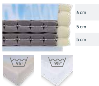
TreviraCS-Spannbezug Inko-Spannbezug, weiß