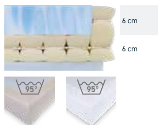
TreviraCS-Spannbezug Inko-Spannbezug, weiß